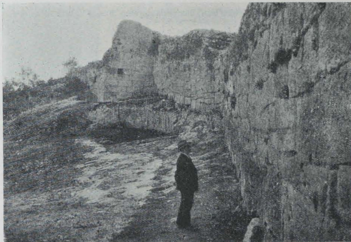
Fig. 372. — Olèrdola. La muralla

A continuació, un gruix de 50 centímetres amb terrissa de l'Edat mitjana i bocins de campaniana (capa D), i, sota d'aquesta, un llit de calç pastada sense sorra (E), de 10 centímetres.